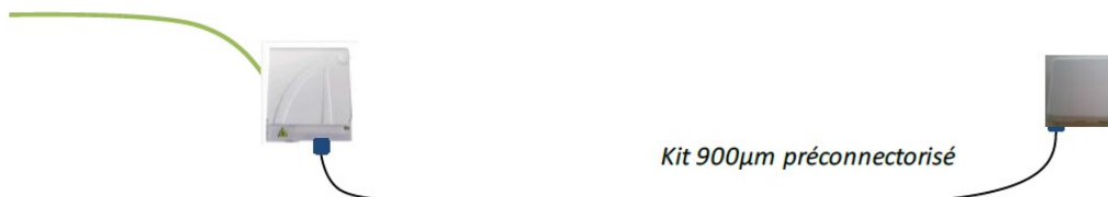
Figure 4 : exemple de câblage avec PTO déportée