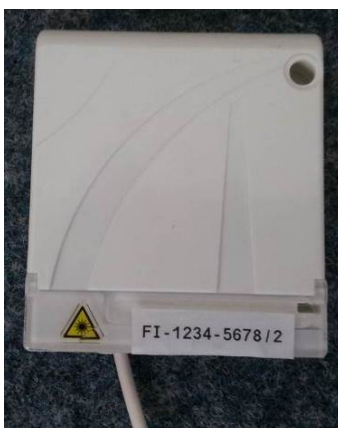
Figure 3 : repérage de la PTO déportée

L'éventuelle PTO monofibre déportée installée dans le prolongement de la PTO située à la pénétration du logement est repérée par : le numéro de la prise OO-XXXX-XXXX/2. Le chiffre « 2 » indique qu'il existe une PTO en entrée de logement.