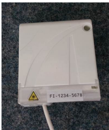
Figure 2 : repérage sur la prise mono fibre

L'éventuelle PTO monofibre déportée installée dans le prolongement de la PTO située à la pénétration du logement est repérée par : le numéro de la prise OO-XXXX-XXXX/2. Le chiffre « 2 » indique qu'il existe une PTO en entrée de logement.